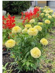
マリーゴールドとサルビア

川下地区社会福祉協議会と川下地区まちづくり協議会の合同事業として、川下出張所周辺花壇の手入れ、川下防災備蓄センター花壇の手入れ、周辺道路の草取りを行いました。参加者は28名でした。その後、川下出張所ではマリーゴールドとサルビアが、防災備蓄センターではアナベルが綺麗に咲きました。