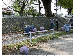
くすのき広場落葉清掃

「くすのき広場」の落葉清掃を行いました。参加者22名で約100袋の落葉を収集しました。例年は「くすのき花火フェスティバル」に向けての作業ですが、残念ながら昨年に続き今年も中止となりました。新型コロナが収束して再開されることを願いながら作業しました。