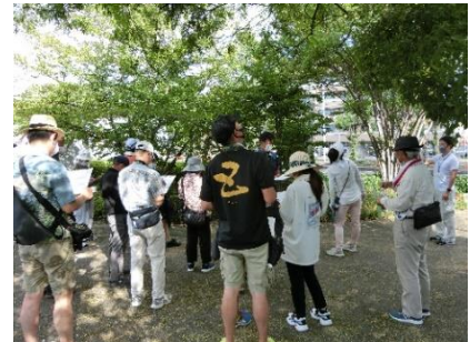
街路樹見学ツアー

「第1回まち協街路樹見学ツアー」を岩国市役所周辺で行いました。都市計画道路楠中津線の街路樹検討の一環として、既存の公園樹・街路樹の見学会を実施しました。公園環境部会・道路交通部会で企画し、コミュニティの日事業として行いました。参加者は22名でした。市役所周辺だけで20種以上の樹木があり、樹高や樹形の確認や、日陰効果を体感することができました。また、街路樹への関心を高めることができました。