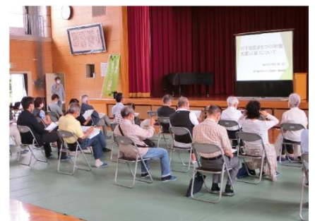
臨時総会(川下小学校講堂)

令和3年7月11日(日)10時～11時、川下小学校講堂において「川下地区まちづくり協議会令和3年度臨時総会」を開催しました。今回の臨時総会では、平成22年7月に策定された「川下地区のまちづくり計画」の改定における「川下地区まちづくり協議会案」について、事務局からの説明の後、活発な意見交換が行われました。